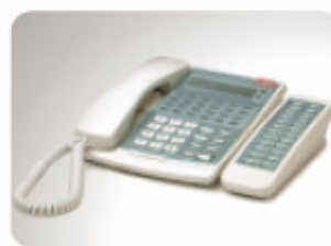
ASPIRE Mini DLS