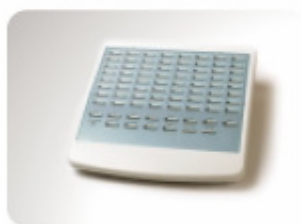
ASPIRE Mini DSS