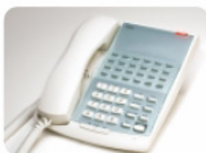
ASPIRE Mini 12 TD