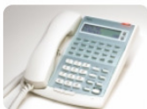
ASPIRE Mini 12 TXD